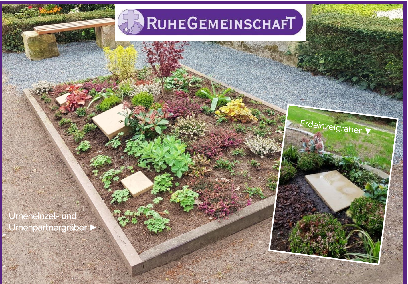
Urneneinzel- und Urnenpartnergräber ▶