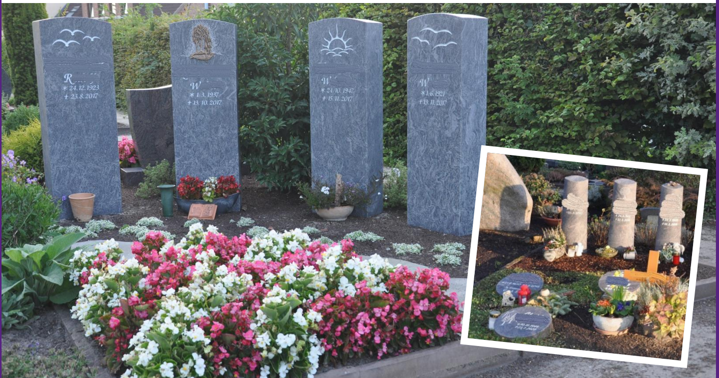
Beispiele für Urnenpartner-Grabstätten (gr. Foto) & Urneneinzelgrabstätten (kl. Foto)